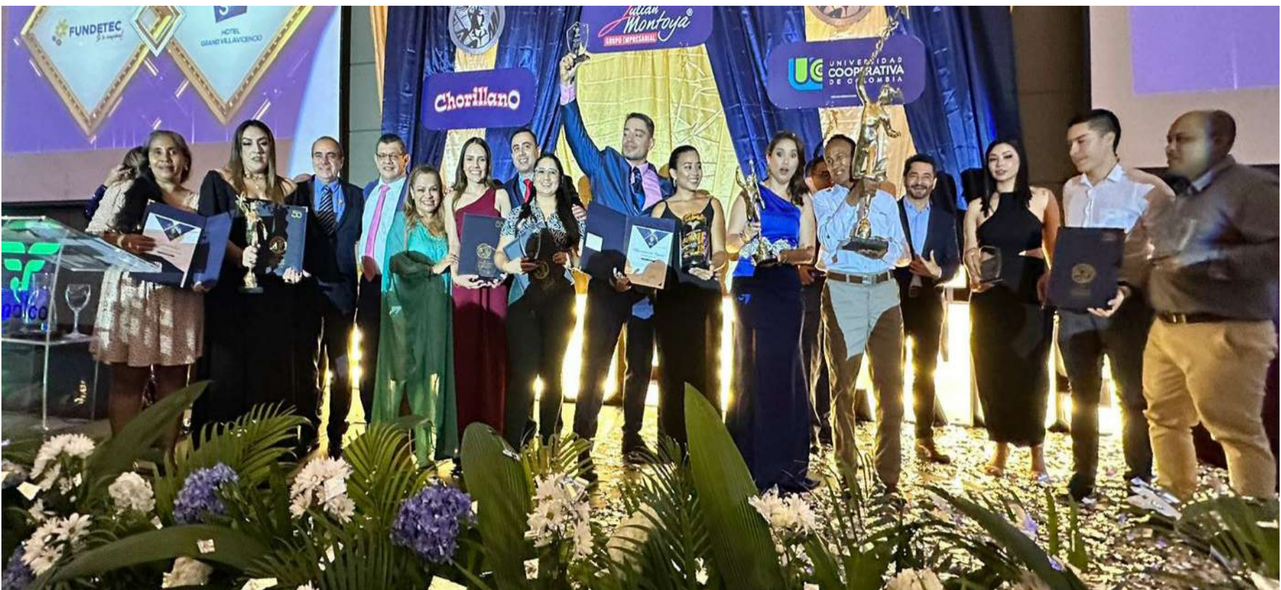
Ganadores en la Noche de los Mejores 2023, evento liderado por Fenalco Meta y Llanos Orientales.

En el marco de la Noche de los Mejores 2023, evento organizado por la Federación Nacional de Comerciantes Empesarios - Meta y Llanos Orientales, en el cual fueron galardonados empresarios, colaboradores y gerentes de reconocidas empresas regionales, se celebró el Aniversario 50 de la Federación.