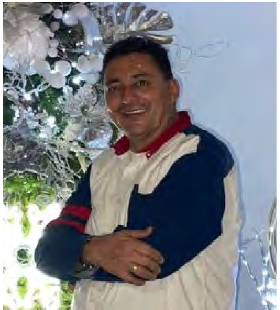
Henry Fernando Ladino González, diputado del Meta

-Fortalecimiento del Fondo de Educación Superior: Este contará con más de 5.000 salarios mínimos, es decir, más de $6.500 millones para el año entrante, con la promesa de que seguirá aumentando para que los jóvenes y ciudadanos metenses puedan estudiar “en el medio, con el medio y para el medio, con programas académicos de universidades que traigan sus programas al Meta (ya hay incentivos para éstas). Y que ya los muchachos no tengan que desplazarse a otros lugares del país para estudiar, ya que esto produce desarraigo familiar, cultural, regional y, sobre todo, la fuga de capitales, porque el que se va, no regresa”, explicó el Diputado.