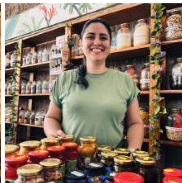
Frijol San Juanito