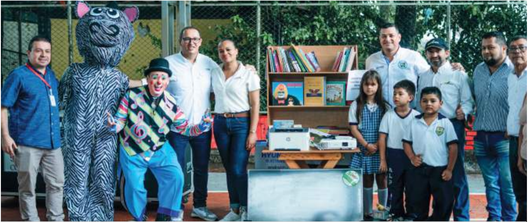
Las “Cajas Viajeras”, beneficiarán a los estudiantes de las sedes de las Instituciones Educativas Alfonso López Pumarejo y Rural Vanguardia, abriendo las puertas al conocimiento en el área digital.

El acceso a la tecnología en el ámbito educativo, especialmente en las áreas rurales, se ha convertido en una meta fundamental para los entes gubernamentales, entendiendo que, por lo general los estudiantes de estas zonas geográficamente aisladas enfrentan grandes desafíos, como: la poca conectividad y accesibilidad a la información, debido a los pocos recursos con los que cuentan en equipamientos informáticos y bibliotecas.