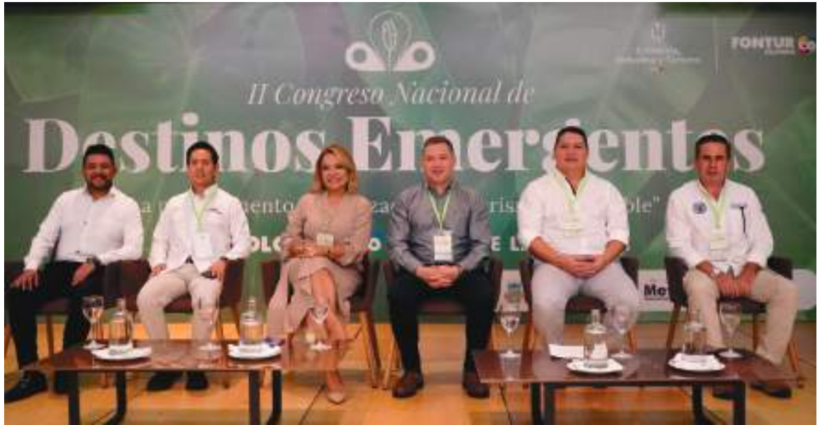
Apertura del II Congreso Nacional de Destinos Emergentes, “La paz, elemento dinamizador del turismo sostenible.

De acuerdo con las cifras del Sistema de Información sobre Biodiversidad -SIB Colombia- el Departamento del Meta, para el 2022 albergaba 17.007 especies de flora y fauna, lo que lo consolida como uno de los territorios más biodiversos del país, sin embargo, en el II Congreso de Destinos Emergentes se afirmó que la sostenibilidad debe