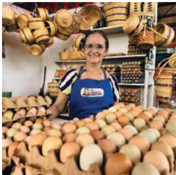
Distri Gallinas Marlene

JLGA: Creo que a pesar de las circunstancias, desde la Secretaría hemos acompañado de manera eficiente a los emprendedores y empresarios, gracias al total compromiso de los profesionales que hacen parte de este gran equipo de trabajo. Uno de los logros obtenidos en este gobierno, ha sido el disminuir en tres puntos la ocupación informal, entendiendo que la informalidad no se limita a quienes laboran de manera independiente, sino a todas las personas vinculadas laboralmente que no están afiliados a salud y riesgos profesionales. Cada día renovamos nuestro compromiso trabajando con responsabilidad y respeto hacia los villavicensenses para hacer que nuestra ciudad se proyecte y se consolide como líder en competitividad y desarrollo a nivel nacional.