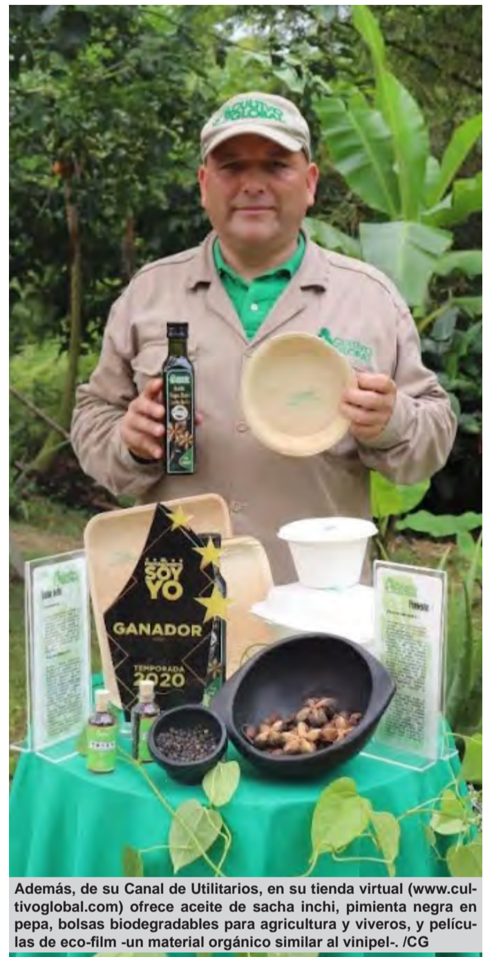
Además, de su Canal de Utilitarios, en su tienda virtual ( www.cultivoglobal.com ) ofrece aceite de sachá inchi, pimienta negra en pepa, bolsas biodegradables para agricultura y viveros, y películas de eco-film -un material orgánico similar al vinipel-. /CG

Adicional a ello, Cultivo Global ofrece la posibilidad de desarrollar proyectos con inversores propietarios de terrenos interesados en crear negocio, o a aquellos con capital para invertir en los campos forestal, agrónomo o medioambiental, asesorándolos como socios estratégicos en el tema de exportación y co-