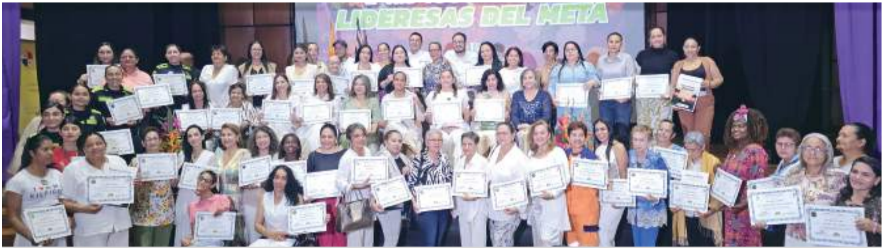
Mujeres que recibieron el reconocimiento otorgado por Confadicol en el teatro La Vorágine en Villavicencio. /LI

Villavicencio fue el escenario del homenaje “100 Grandes Lideresas del Meta”, un reconocimiento otorgado por la Confederación Nacional de Asambleas y Diputados de Colombia -Confadicol-, para destacar el liderazgo de mujeres que han contribuido al desarrollo del departamento en las áreas: social, cultural y deportiva. La ceremonia, realizada en el Teatro La Vorágine, contó con la participación de destacadas mujeres y fue organizada por el Departamento de Derechos Humanos de Confadicol,