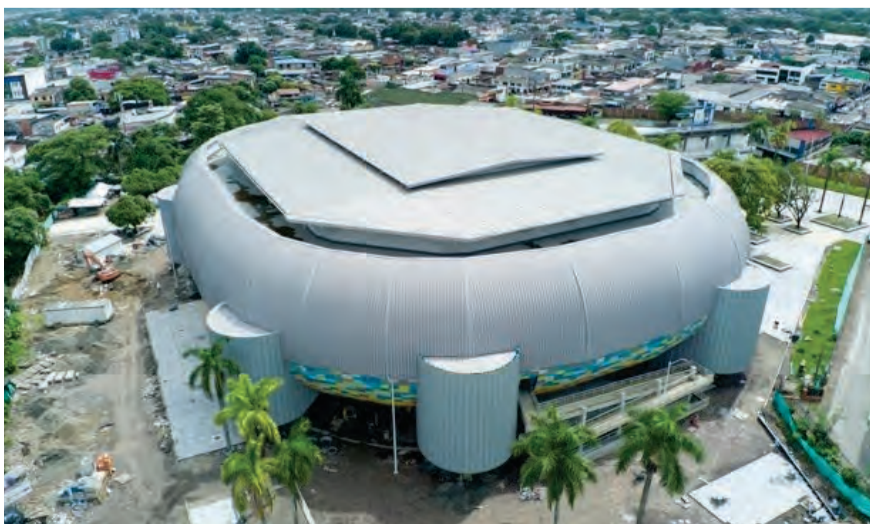
Coliseo Álvaro Mesa Amaya. / Alberto Duarte

Catama – Caños Negros: Por un valor superior a $14.000 millones, se mejoró la vía entre la avenida Catama y la vereda Caños Negros, con manejo de aguas lluvias y la pavimentación y señalización de 11.5 kilómetros.