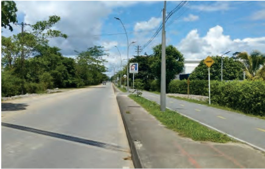
Corredor Ecológico Fase 1 - Villavicencio. /LI

En los últimos días, Marcela Amaya García, ex-gobernadora del Meta, ha venido contándole a los metenses acerca de las obras que se proyectaron, diseñaron, gestionaron y ejecutaron durante su administración, y que han permitido mejorar la calidad de vida de los habitantes del Meta. En entrevista con Llanoalmando.com, nos contó que durante su mandato como primer mujer gobernadora elegida popularmente, se gestionaron un gran número de obras de infraestructura vial, que han permitido mejorar la conectividad terrestre del Meta.