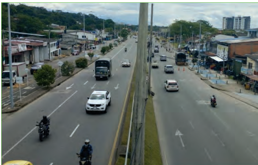
Dobles Calzadas Fundadores-Porfía. /LI

Conexiones Intradomiciliarias: Se beneficiaron a 7.089 familias de 22 municipios del Meta con el programa de conexiones intradomiciliarias de acueducto y alcantarillado.